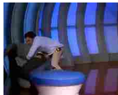
Altro che lieto fine, al 'C'è posta per te' marocchino scatta la