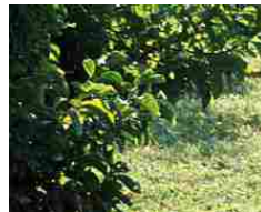
Follie dagli Usa, 81enne sorpreso a fare sesso con un cespuglio