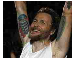
Jovanotti sulla moglie Francesca: "Tante cose le ho fatte per farla"