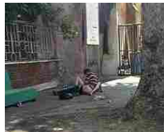
Roma, sesso in strada tra i rifiuti nel cuore di Trastevere