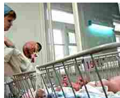
Rischiava soffocamento, neonata estratta parzialmente da utero e